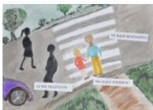
Grupa IV Miejsce V. Karolina Bujak, Internat Zespołu Szkół Ponadgimnazjalnych nr 1 w Kielcach