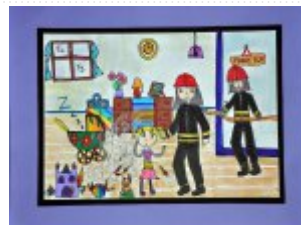
Grupa I Miejsce III. Aleksandra Bury, Szkoła Podstawowa nr 1 w Końskich