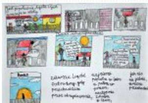
Grupa I Miejsce I. Franciszek Sałata, Zespół Placówek Oświatowych Publiczna Szkoła Podstawowa nr 1 im. Tadeusza Kościuszki w Staszowie