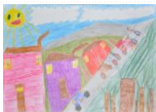
Grupa IV Miejsce I. Iwona Walczak, Zespół Placówek Szkolno- Wychowawczych- Rewalidacyjnych w Cudzynowicach gm Kazimierza Wielka