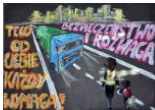
Grupa III Miejsce V. Emilia Strójwaś, Zespół Placówek Oświatowych Gimnazjum w Morawicy

Zespół Placówek Oświatowych Publiczne Gimnazjum nr 1 im. Tadeusza Kościuszki w Staszowie