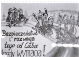
Grupa III Miejsce I. Michalina Kozioł, Zespół