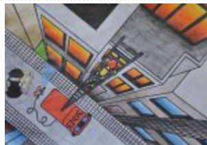
III grupa - miejsce III - Klaudia Majkowska - Zespół Placówek Oświatowych Gimnazjum w Morawicy