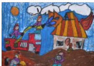
I grupa – miejsce IV - Mirosława Mrówka -