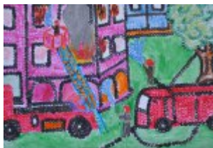
IV grupa – miejsce III - Wiktoria Koman - Niepubliczny Młodzieżowy Ośrodek Wychowawczy w Starym Węgrzynowie