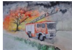
III grupa - miejsce IV - Monika Iwanicka - Gimnazjum Nr 26 im. Wojciecha Szczepaniaka w Kielcach