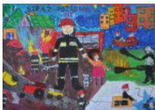
I grupa – miejsce I - Kacper Adamczyk - Szkoła Podstawowa im. Batalionów Chłopskich w Kleczanowie