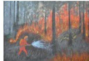
III grupa - miejsce I - Julia Wejman - Zespół Szkoł Leśnych w Zagnańsku