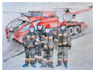
IV grupa - miejsce I - Piotr Nieśpielak - Specjalny Ośrodek Szkolno-Wychowawczy Nr 2 w Kielcach