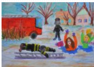
I grupa – miejsce III - Amelia Świrta -