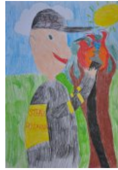
I grupa - miejsce V - Kamil Foks - Szkoła Podstawowa Nr 8 im. Wojska Polskiego w Kielcach

Szkoła Podstawowa Nr 1 im. Tadeusza Kościuszki w ZSO w Sędziszowie