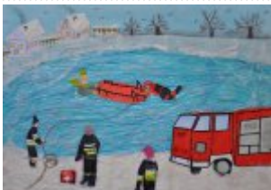
III grupa - miejsce II - Paweł Gidel - Gimnazjum im. gen. Kazimierza Tańskiego w Chmielniku