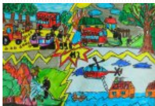
I grupa miejsce III. - Jan Legwant - Szkoła Podstawowa im. Batalionów Chłopskich w Kleczanowie gm. Obrazów