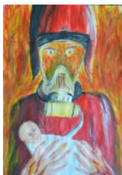
III grupa miejsce III. - Natalia Jagieła - Gimnazjum Nr 1 w Starachowicach