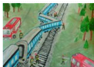
III grupa miejsce I. - Marta Maroń - Zespół Szkół w Seceminie