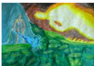
IV grupa miejsce IV. - Jakub Łukawski - Państwowe Ognisko Plastyczne w Starachowicach