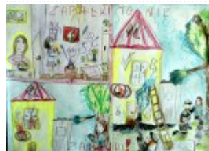
I grupa miejsce V. - Kalina Toborek - Zespół Placówek Oświatowych we Włoszczowie