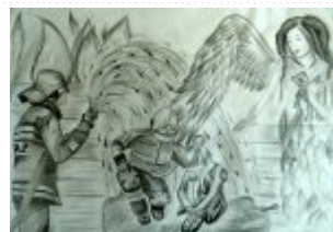
II grupa miejsce III. - Aleksandra Kozieł - Szkoła Podstawowa w Szerzawach gm. Pawłów