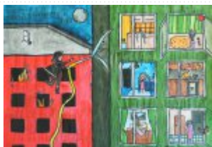
II grupa miejsce II. - Wiktoria Bąk - Szkoła Podstawowa Nr 2 w Busku-Zdroju