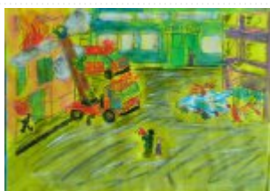
IV grupa miejsce III. - Krzysztof Kozioł - Specjalny Ośrodek Szkolno-Wychowawczy w Broninie