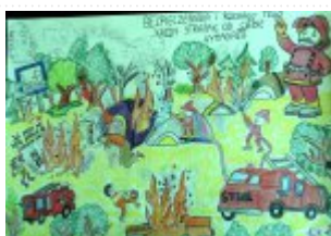
II grupa miejsce IV. - Patrycjusz Leśniewski - Zespół Szkolno-Przedszkolny w Wiślicy