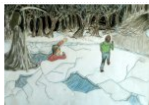
III grupa miejsce IV. - Natalia Łyczek - Publiczne Gimnazjum w Rudzie Malenieckiej