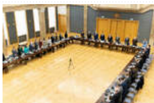
ZDj. Ministerstwo Spraw Wewnętrznych i Administracji